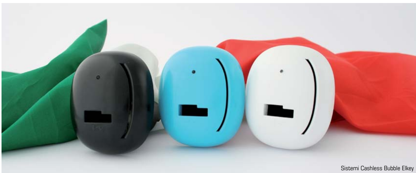
Sistemi Cashless Bubble Elkey

La nostra squadra è composta da 30 persone tra soci, dipendenti, e consulenti. Gli obiettivi sono ambiziosi e misurati agli investimenti che stiamo facendo e si valuteranno in funzione dei risultati raggiunti come è giusto e opportuno che sia.